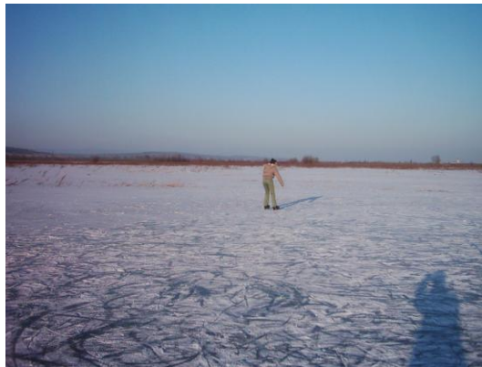
A befagyott csádalj

„...védelem és gondozás nélkül állnak, sőt törvényes védelem híján rohamosan pusztulnak más, mondhatnánk darabszámban található természeti emlékeink...”